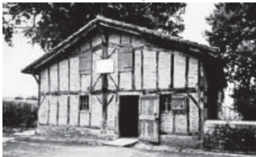
Casa natal de Vicente de Paúl em Pouy (Dax).

La última enfermedad puede decirse que comenzó en 1656. Se le declararon unas fiebres altísimas y la inflamación de las piernas llegó hasta las rodillas. Se recobró lo suficiente para retornar al trabajo, pero, ya nunca más se puso bien del todo. Las fiebres eran cada vez más frecuentes, perdió el apetito, sobre todo durante una cuaresma, que pasó casi sin probar bocado de cualquier cosa, y la inflamación de las piernas se hizo permanente. Para cúmulo de males, a comienzos de 1658 tuvo un accidente. Un día, al regresar de París, se rompió un muelle de la carroza, esta se cayó de un lado, y Vicente sufrió un fuerte golpe en la cabeza. Pocos meses más tarde, se presentó una nueva complicación: se le enfermó un