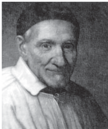
San Vicente. Retrato por Simon Francois conservado en Moutiers-Sain Jean.

En nuestro artículo, que salió en el Anuario Espírita 1999, tuvimos