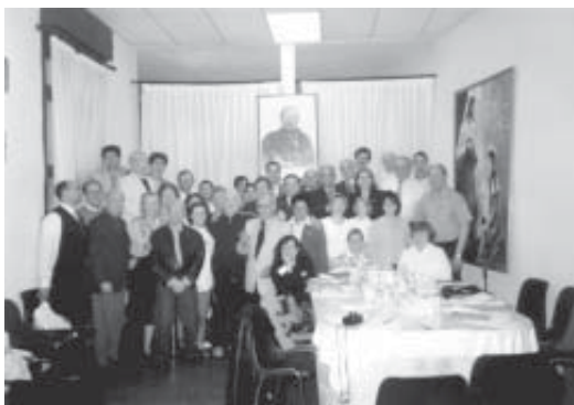
Grupo de los asistentes a las reuniones del C.E.I. Europa en el Centro de Estudios y Divulgación Espírita de Madrid, el día 4 de abril de 1999.

Fueron días de grata convivencia y trabajo que sirvieron para propiciar el