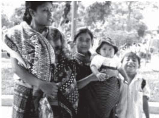
Familia indígena guatemalteca